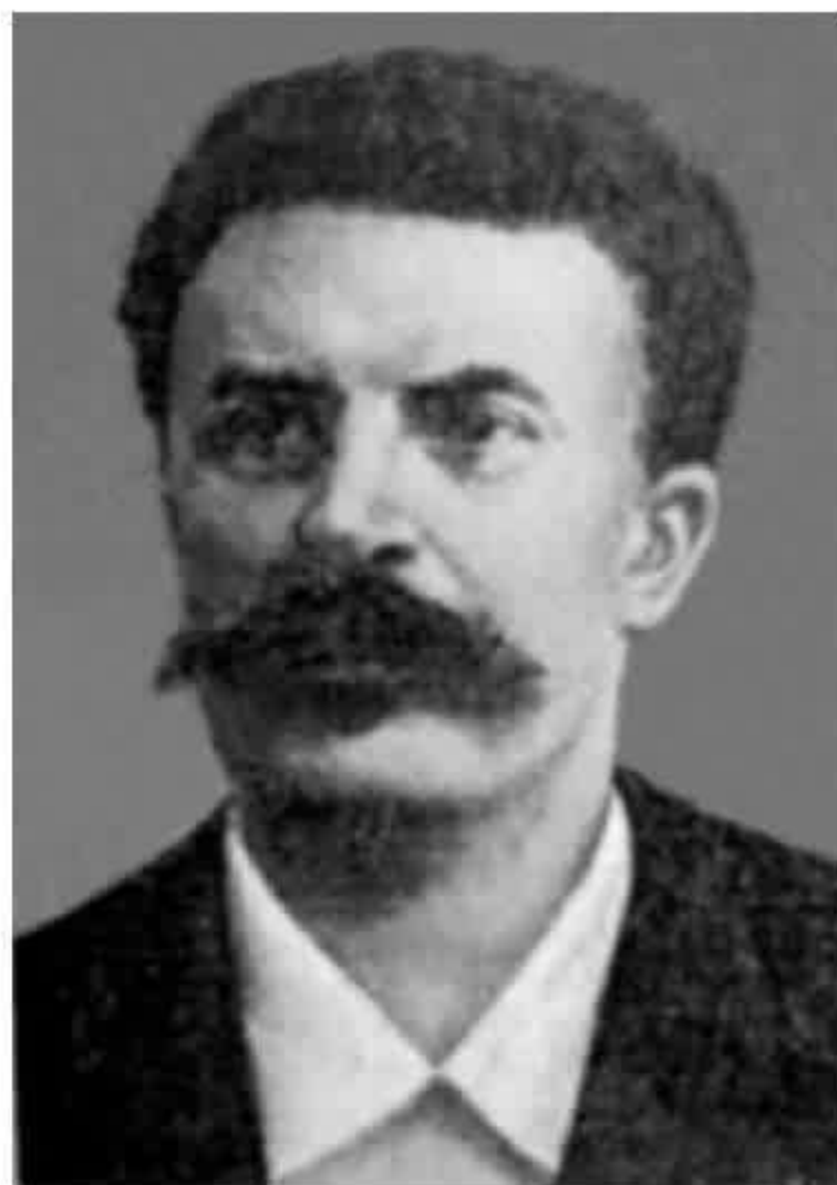
G. ĐƠ MÔ-PA-XĂNG

Văn bản Bố của Xi-mông trích truyện ngắn cùng tên. Chị Blăng-sốt trong truyện này bị một người đàn ông lừa dối, sinh ra Xi-mông. Vì vậy, Xi-mông trở thành một đứa trẻ không có bố dưới con mắt mọi người. Truyện bắt đầu khi Xi-mông lúc đó khoảng bảy, tám tuổi, lần đầu tiên đến trường bị đám học trò chế giễu là không có bố.